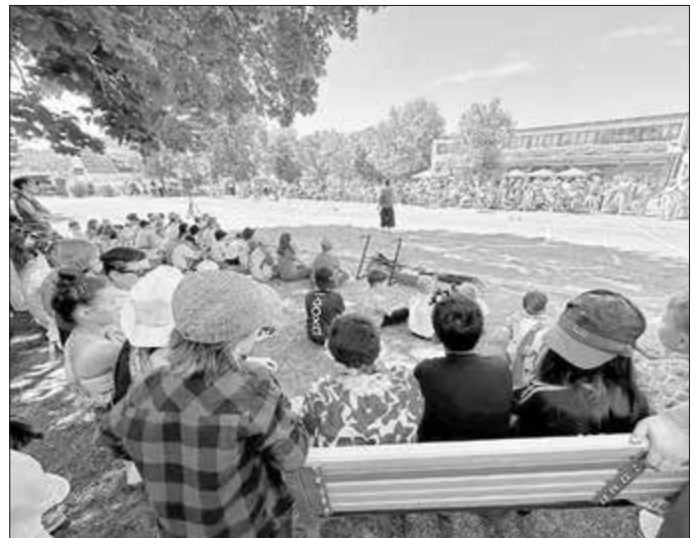
Schulfest in der Johann-Gemmer-Schule