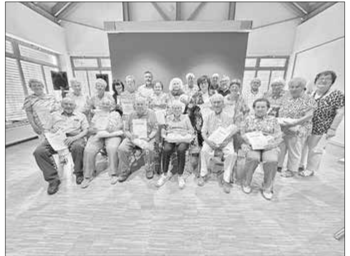
Ehrungen im Marienverein

Weiterhin fand auch die Mitgliederversammlung des Marienvereins Ahorn statt in dessen Rahmen langjährige Mitglieder geehrt wurden. Ein großer Dank auch an das fleißige Team des BRK-Marienvereins und der BRK Wasserwacht Ortsgruppe Ahorn-Witzmannsberg für die regelmäßige Durchführung der Blutspende im Bürgerhaus Linde in Ahorn. Nächster Blutspendetermin ist am 5. August 2025, von 16.00 bis 20.00 Uhr, im Bürgerhaus Linde in Ahorn. Sehr herzlich sind auch Erstspender willkommen.