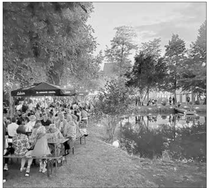
Nacht der Lichter Eicha