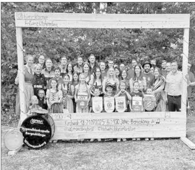
Kirchweih Witzmannsberg und 100 Jahre Bergesklänge