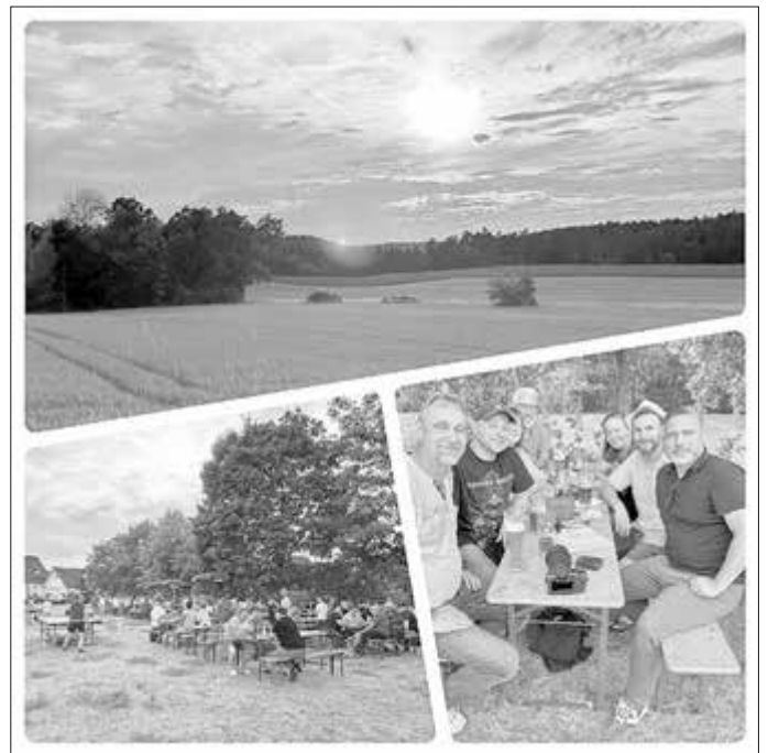
Sonnwendfeier RV Bavaria Schorkendorf