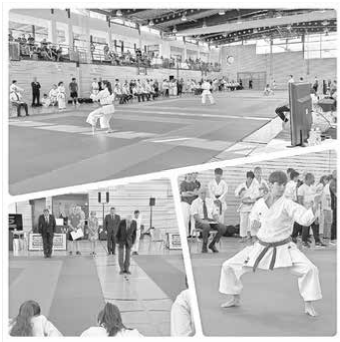
Bay. Landesmeisterschaften Karate in Ahorn

Die Bayerischen Landesmeisterschaften Karate fanden Anfang Juli bei uns in Ahorn statt. Beeindruckende junge Sportler zeigten einen Sport der begeistert.