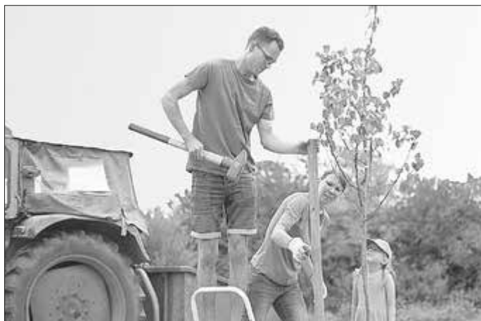
Beim Pflanzen helfen alle zusammen

Wie Kommunen, Vereine oder Verbände Streuobstbäume beantragen können, hat das Amt für Ländliche Entwicklung Oberfranken in einem kurzweiligen Erklärvideo unter https://land-belebt.bayern/streuobst-fuer-alle zusammengefasst.