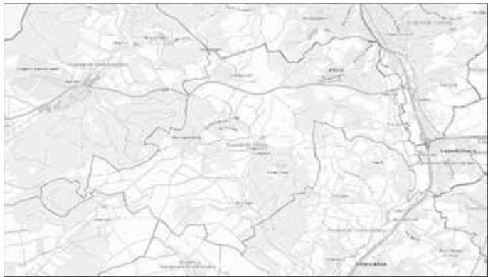
Übersichtslageplan, unmaßstäblich auf der Grundlage der TK 25.000 mit Dar-stellung des Gemeindegebiet