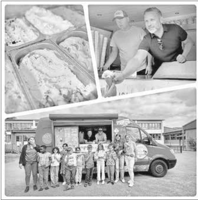
Eis für die Schulkinder

Die Bayerischen Landesmeisterschaften Karate fanden Anfang Juli bei uns in Ahorn statt. Beeindruckende junge Sportler zeigten einen Sport der begeistert.