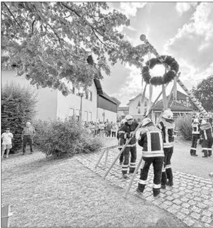
Kirchweihbaum aufstellen in Witzmannsberg