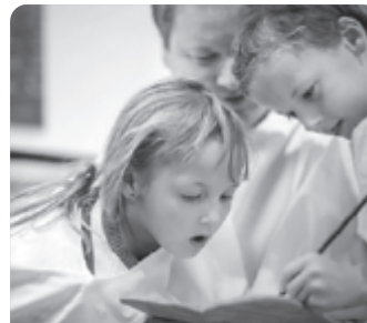
Entdecken und staunen