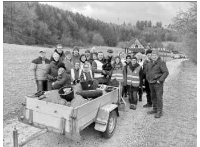
Das Bild ist vor der Corona-Pandemie entstanden.