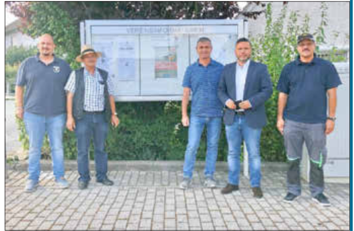
Schaukasten für Vereinsinformationen in Schorkendorf.

Im Bayerischen Teil der Initiative Rodachtal muss 20 % der Projekt Nettokosten und die MwSt als Eigenanteil aufgebracht werden. Dabei ist aber zu beachten, dass bei Kleinprojekten maximal bis zu 2.500 € Förderung der Nettokosten durch die Initiative erfolgen kann.