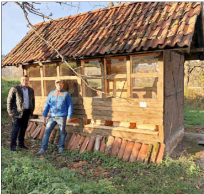
Renovierung eines Bienenhauses an der Alten Schäferei.

Der „Projekt-Fantasie“ sind dabei kaum Grenzen gesetzt. Voraussetzung ist: es müssen mindestens 5 Personen sich für das Projekt engagieren.