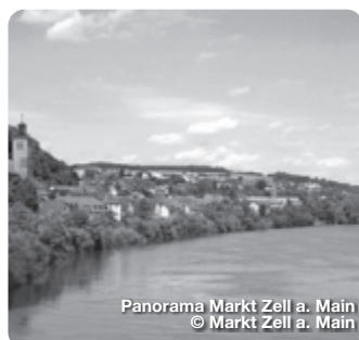
Panorama Markt Zell a. Main

Im Zeller Altort gibt es viel zu sehen. So z. B. die Zeller Weinhändlerhäuser, das Wassermuseum und den Kulturkeller, den Bürgerbräustollen, die Rosenbaumsche Laubhütte und das Areal des ehemaligen Klosters Unterzell TreffpunktDeutschland.de/zell-am-main