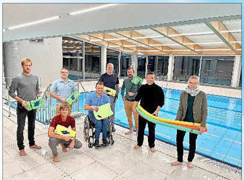
Die Bad Rodacher Thermalbad Service GmbH freut sich nach EU-Ausschreibung den Zuschlag erhalten zu haben.

Der Eintritt beträgt 2 € pro Person. Laut behördlicher Regelung gilt für den öffentlichen Betrieb die 2G-PLUS Regel. Es wird empfohlen bereits ein negatives Testergebnis einer offiziellen Teststelle mitzubringen. Geboosterte sind von der Vorlage eines Coronatestes ausgenommen. Kinder bis zum 6. Geburtstag sowie Schülerinnen und Schüler, die in der Schule regelmäßig getestet werden sind ebenfalls von der Testpflicht befreit.