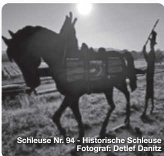
Schleuse Nr. 94 - Historische Schleuse