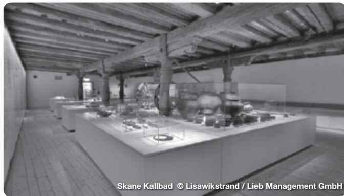
Skane Kallbad